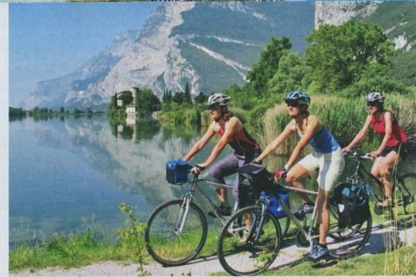
Ein neuer Radweg führt vom Fassa-Tal bis zum Gardasee.

Trentino, Emilia Romagna und Sizilien besonders gefördert. Als erstes sollen zwei neue Radweg-Konzepte im Trentino verwirklicht werden. Eine 400 Kilometer lange Verbindung von den Dolomiten bis zum Gardasee, sowie die Umrundung des Brenta-Massives auch für Trekkingbiker. Gemeinsam mit den Hotels wird dabei sogar der Gepäcktransport organisiert.